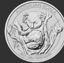
Kookaburra/Koala 1 kg