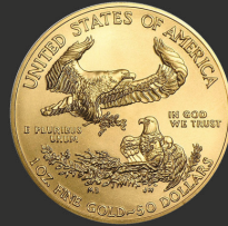
American Eagle 1 oz (31,10 g)