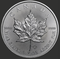
Maple Leaf 1 oz (31,10 g)