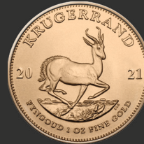
Krügerrand 1 oz (31,10 g)