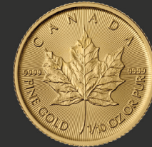
Maple Leaf, American Eagle, Krügerrand, Wiener Philharmoniker 1/10 oz (3,11 g)