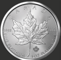
Maple Leaf 1 oz (31,10 g)