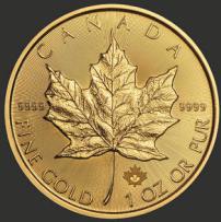
Maple Leaf 1 oz (31,10 g)