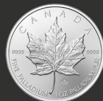
Maple Leaf 1 oz (31,10 g)