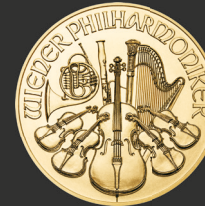
Wiener Philharmoniker 1 oz (31,10 g)