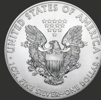
Amercian Eagle 1 oz (31,10 g)