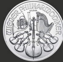
Wiener Philharmoniker 1 oz (31,10 g)