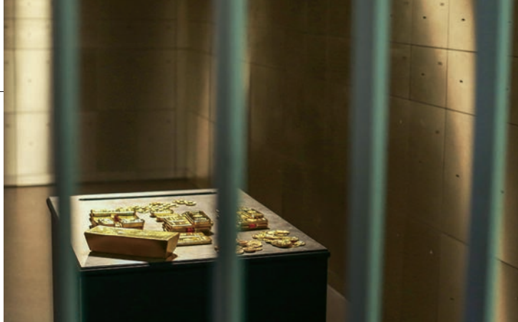
HOCHSICHERHEITSTRESOR: Die Lagerung ist ein wichtiges Kriterium

Für die Vergabe der jeweiligen Note wurden die erreichbaren Punkte in jeder Kategorie in eine prozentuale Einstufung gebracht. Dabei ergaben 100 Prozent bis 80 Prozent der erreichbaren Punkte die Note „Sehr Gut“, 79,99 Prozent bis 60 Prozent ein „Gut“, 59,99 Prozent bis 40 Prozent ein „Befriedigend“ und so weiter in 20-Prozent-Schritten. Danach hat das DFSI die Gesamtbewertung aus den Einzelteilbewertungen errechnet. Dabei wurden die einzelnen Unterkategorien nochmals zueinander gewichtet: „Bester Service“ (inklusive Transparenz) 45 Prozent, „Bester Preis“ 45 Prozent und „Günstigste Auslieferung“ zehn Prozent.